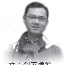
文：剑不虚发 公司执行董事